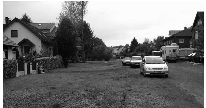
Am Ziegenberg: Hier floss einst der Jungfernbach

Fast in Vergessenheit geraten wäre der alte und einzige Bachlauf durch den Stadtteil Jungfernkopf, wenn nicht eine Straße im Neubaugebiet parallel zur Straße Am Ziegenberg den Namen „Zum Jungfernbach“ bekommen hätte. Doch wo liegt er eigentlich, der Jungfernbach, fragt sich der Interessierte. Leider nicht mehr sichtbar unter der in der Zwischenzeit zur Hauptverkehrsstraße gewordenen Straße Am Ziegenberg.