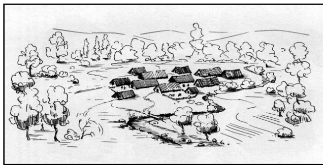
Bandkeramisches Dorf, wie es an der heutigen Holländischen Straße auf dem Terrain der Henschelwerke hätte liegen können.

(Quelle u.a.: Dr. J. Bergmann, Urgeschichte des Stadtkreises Kassels, Kassel 1962)