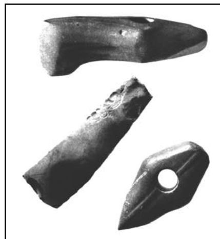
Steinäxte, die untere aus der Zeit des Übergangs zur Bronzezeit

Eine weitere Bandkeramische Siedlung wird in der Nähe des Geilebachs in Höhe